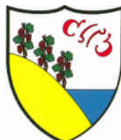
Commune de Corcelles – Cormondrèche