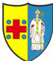
Commune de Chézard-Saint-Martin